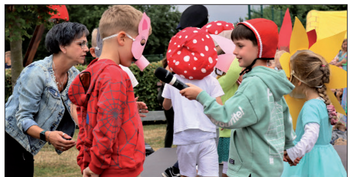
Fanfarenzuges Crimmitschau sowie durch die Mitmachaktionen der Ortsfeuerwehr Langenreinsdorf und der Deutschen Verkehrswacht.

Abgerundet wurden die Feierlichkeiten durch den Auftritt des