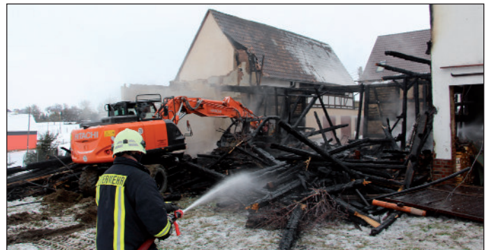
Einsatz beim Brand in Dänkriz

Unbestrittener Höhepunkt des Jahres 2021 war die Übergabe des neuen Gerätehauses in Langenreinsdorf am 03.09.21. „Im Vergleich vom alten zum neuen Gerätehaus kann man hier sicher von einem Quantensprung sprechen“, betonte der Gemeindeführer und bedankte sich gleichzeitig bei dem Landratsamt Zwickau, dem Freistaat Sachsen als Fördermittelgeber, der Stadtverwaltung und den beteiligten Baufirmen. Mit dem neuen Gebäude haben die rund 65 Kameradinnen und Kameraden nicht nur ein modernes Feuerwehrgerätehaus, sondern auch eine großräumige Fahrzeughalle und 12 zusätzliche Parkplätze direkt am Haus erhalten. Durch den Umbau des ehemaligen Gaststättenbereiches im Weißen Schwan sind Funktionsräume entstanden, die als Vereinsraum sowie als Wehrleiter- und Lagerraum genutzt werden können.