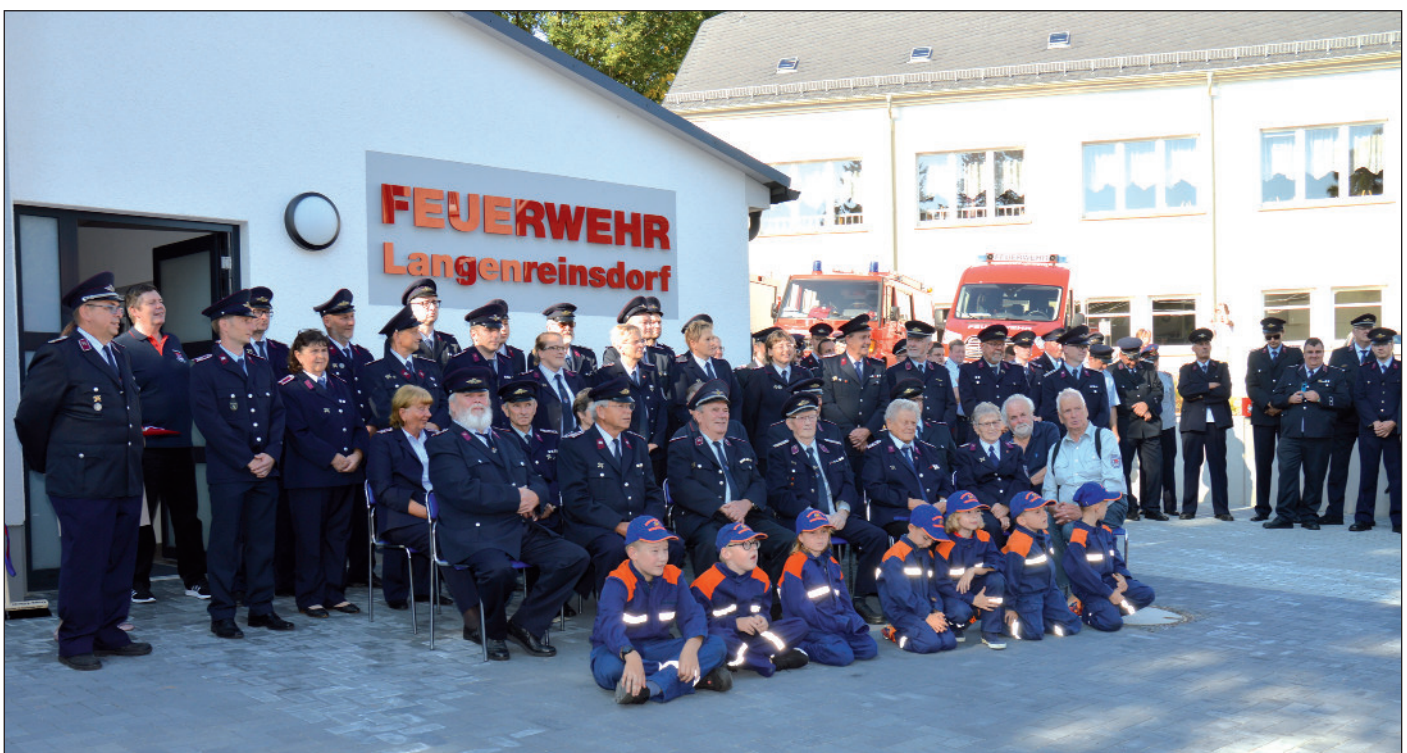
Einweihung des Feuerwehrgerätehauses in Langenreinsdorf.