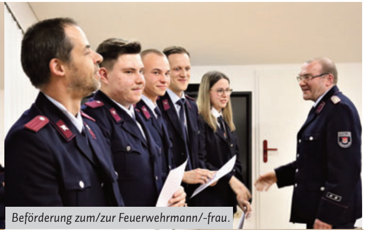
Beförderung zum/zur Feuerwehrmann/-frau.