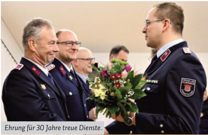
Ehrung für 30 Jahre treue Dienste.