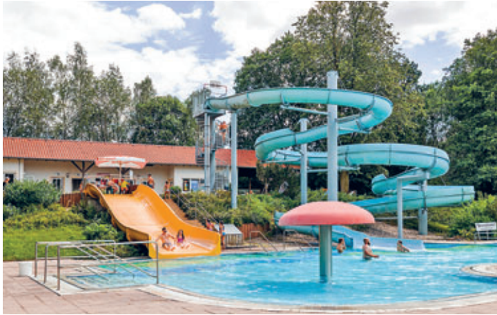
Freizeit- und Erlebnisbad Mannichswalde

Die Crimmitschauer Freibäder beendeten am 03.09.23 eine erfolgreiche Badesaison 2023. Rund 25.000 Badegäste im Sahnbad und rund 27.000 Badegäste im Freizeit- und Erlebnisbad Mannichswalde konnten seit dem 26.05.23 begrüßt werden. Neben einer guten Wasserqualität boten die Freibäder wieder viel Raum für Spiel und Spaß sowie Abkühlung an heißen Sommertagen. Für den reibungslosen Badebetrieb investiert die Stadt Crimmitschau jährlich einen mittleren 6-stelligen Betrag in beide Freibäder.