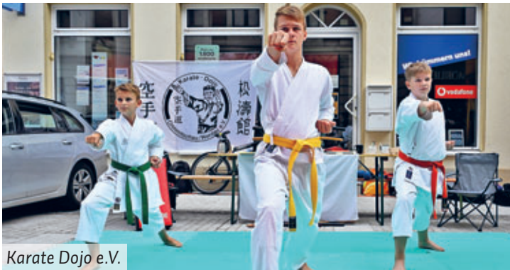
Karate Dojo e.V.