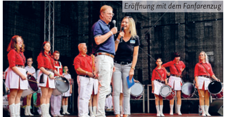
Eröffnung mit dem Fanfarezug