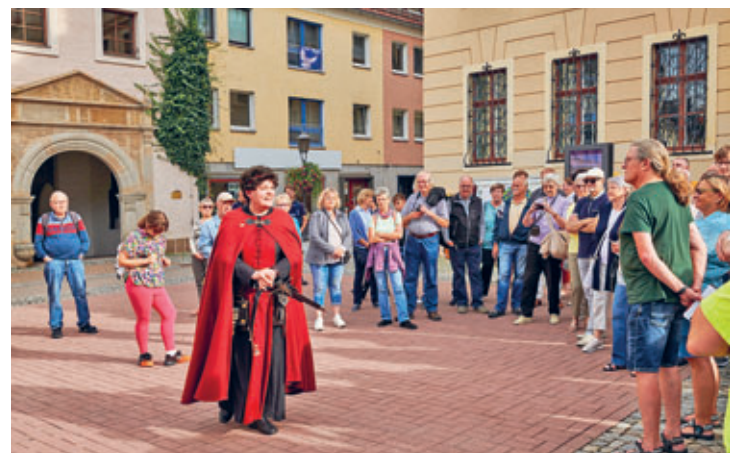
Chlodhilde die Fränkin stellt sich auf dem Marktplatz vor.

Crimmitschau, auf dem Marktplatz. Gegen 16 Uhr begannen die Grußreden sowie die Auftritte der Gildemitglieder mit musikalischen oder sprachlichen Beiträgen. Neben den Gildebrüdern und -schwestern sowie deren Begleitpersonen waren auch zahlreiche Bürgerinnen und Bürger anwesend.