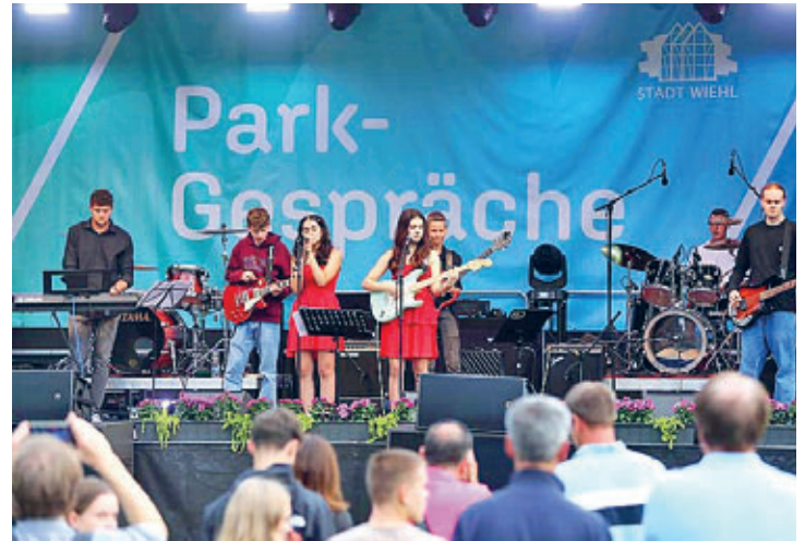
Die Band „Flyyy“ der Musikschule eröffnete das Live-Programm am Freitag.

Mehrere Tausend waren am Wochenende vom 25. bis 27.08.2023 im neu eröffneten Wiehlpark unterwegs, erlebten Live-Musik, genossen an vielen Ständen die Angebote der Wiehler Gastronomie, betätigten sich sportlich oder verfolgten mit ihren Kindern ein buntes Bühnenprogramm.