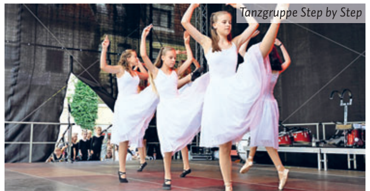
Tanzgruppe Step by Step