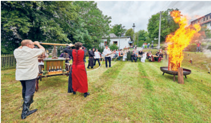
Löschangriff der Gildemitglieder mit einer Spritze aus dem Jahr 1850 in Rudelswalde.

Zum Regionaltreffen Ost der Gilde versammelten sich Nachtwächter, Türmer und Figuren aus Deutschland und Österreich vom 31.08. bis 03.09.23 in Crimmitschau. Für das Treffen, welches insgesamt bereits zum zweiten Mal in Crimmitschau stattfand, waren rund 20 Mitglieder angereist. In der Gilde der Nachtwächter, Türmer und Figuren haben sich mittlerweile über 200 Frauen und Männer zusammengeschlossen, die sich als gewandete Figuren der Kultur, Geschichte und Tradition verbunden fühlen.