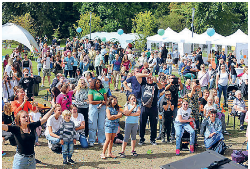
Bei Sonnenschein genoss ein buntes Publikum das Unterhaltungsprogramm auf der Bühne.

Wiehl ist eine Stadt im Oberbergischen Kreis im Regierungsbezirk Köln in Nordrhein-Westfalen (Deutschland), mit einer Einwohnerzahl von 26.290 und einer Fläche von 53,26 km 2 .