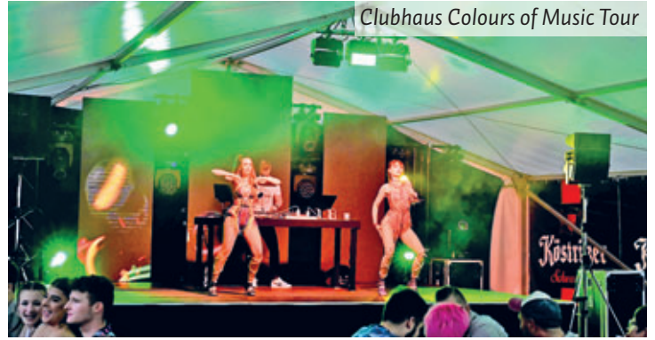
Clubhaus Colours of Music Tour