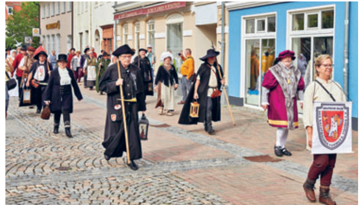
Gildemitglieder versammeln sich auf dem Marktplatz.