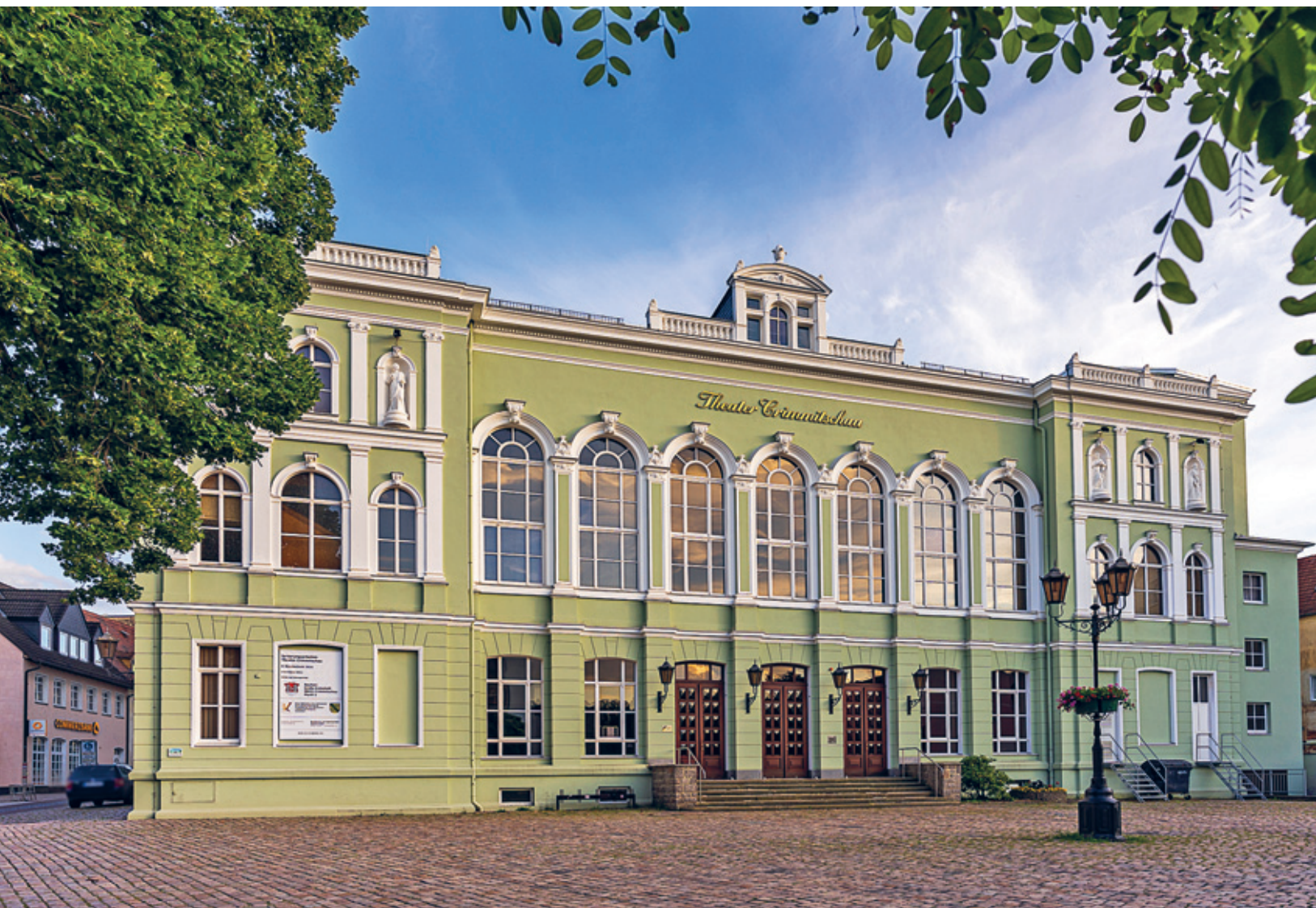
Blick auf das Theater Crimmitschau