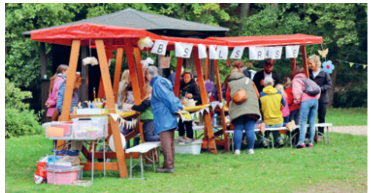
Bastelstraße des Kinderherbstfestes

Ein besonderes Highlight des Festes war die feierliche Einweihung des restaurierten Holzzuges auf dem Spielplatz. Über mehrere Monate hinweg haben die Vereinsmitglieder mit viel Hingabe und Liebe zum Detail den Zug saniert, der nun wieder in voller Pracht strahlt und die Kinderherzen höherschlagen lässt. Die Kosten für die Restauration des Holzzuges belaufen sich auf rund 5.500 Euro. Unter-