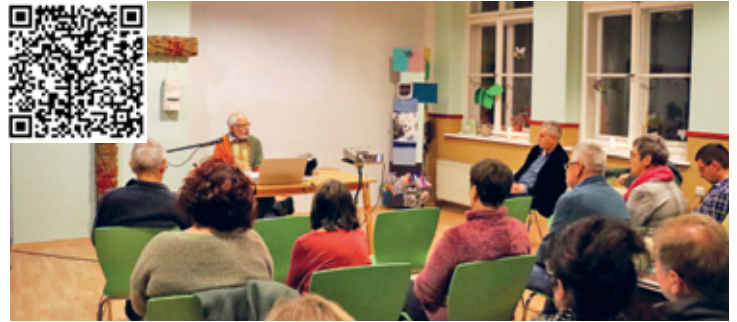
Crimmitschau liest im CVJM 2023

Das Programm können Sie unter www.crimmitschau.de nachlesen.