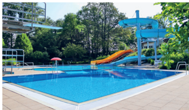
Freizeit- und Erlebnisbad Mannichswalde